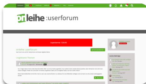
Superbanner 728 x 90 Pixel oben