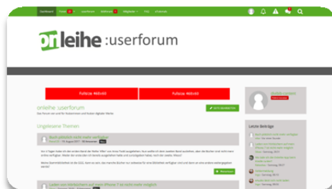
Fullsize-Banner 468 x 60 Pixel oben