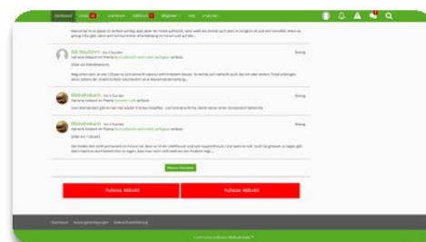
Fullsize-Banner 468 x 60 Pixel unten