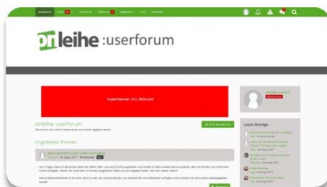
Superbanner XXL 960 x 160 Pixel oben